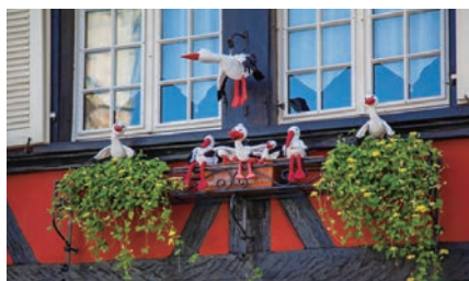
アルザスは野生のこうのどりの生息地としても有名。アルザスのシンボルの一つとして愛されているせいか、家にも飾りものを。