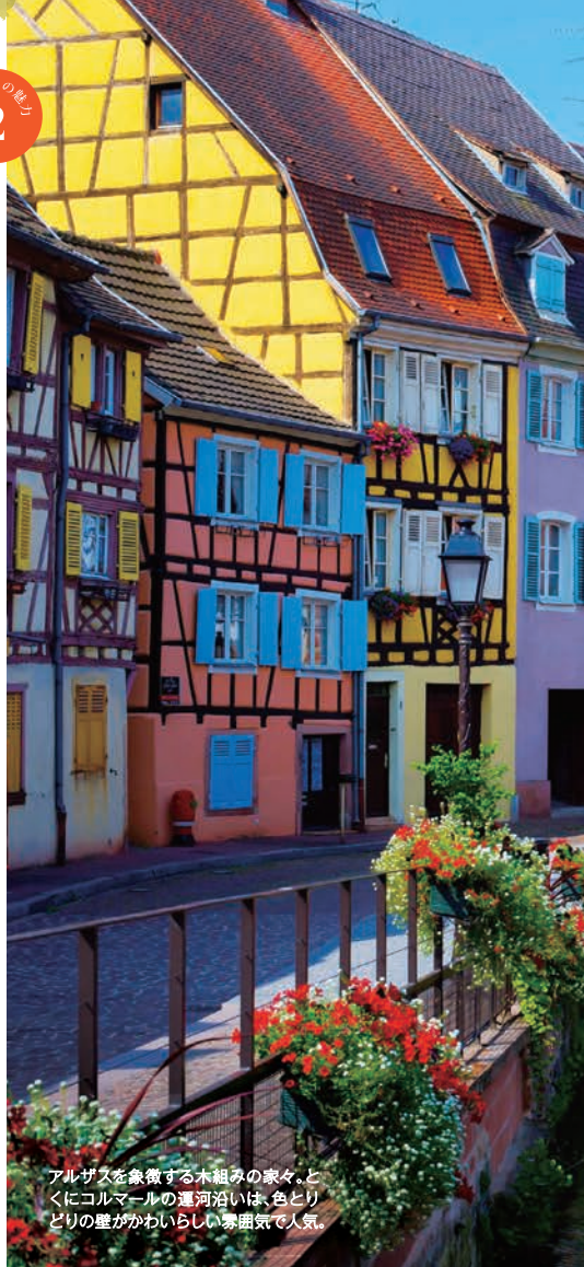
アルザスを象徴する木組の家々。とくにコルマルの運河沿いは、色とりどりの壁がかわいらしい雰囲気です。