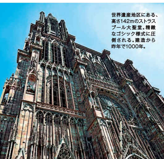
世界遺産地区にある、高さ142mのストラスブール大聖堂。精緻なゴシック様式に圧倒される。建造から昨年で1000年。