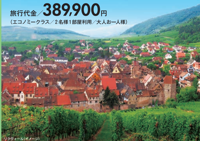
リクヴィール(イメージ)