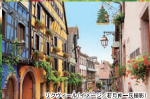
リクヴィール(イメージ/若月伸一氏撮影)