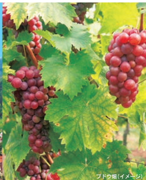
ブドウ畑(イメージ)