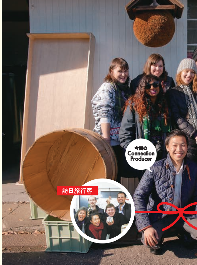
今回の Connection Producer